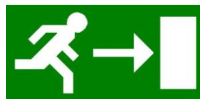
Figuur 4 Nooduitgang

Bij het horen van het ontruimingssignaal dient iedereen de werkplek onmiddellijk te verlaten via een veilige en kortste weg. De dichtstbijzijnde nooddeur is te vinden door het volgen van de vluchtwegbewijzing ( figuur 4 ). Verder dient iedereen de aanwijzingen van bedrijfshulpverleners op te volgen. De vluchtrouteaanduiding dient te allen tijde goed zichtbaar te zijn.