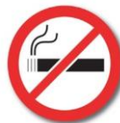
Figuur 1: Niet-roken symbool