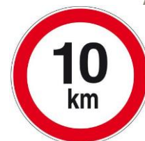
Figuur 5: Max. snelheid