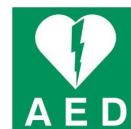
Figuur 3: AED